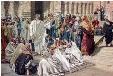
Pharisees Question Jesus by James Tissot

Lúc Người lìa dân chúng mà về nhà, các môn đệ hỏi Người về ý nghĩa dụ ngôn ấy. Người liền bảo các ông: "Các con cũng mê muội như thế ư? Các con không hiểu rằng tất cả những gì từ bên ngoài vào trong con người không thể làm cho người ta ra ô uế được, vì những cái đó không vào trong tâm trí, nhưng vào bụng rồi xuất ra". Như vậy Người tuyên bố mọi của ăn đều sạch. Người lại phán: "Những gì ở trong người ta mà ra, đó là cái làm cho người ta ô uế. Vì từ bên trong, từ tâm trí người ta xuất phát những tư tưởng xấu, ngoại tình, dâm ô, giết người, trộm cắp, tham lam, độc ác, xảo trá, lăng loàn, ganh tị, vu khống, kiêu căng, ngông cuồng. Tất cả những sự xấu đó đều ở trong mà ra, và làm cho người ta ra ô uế".